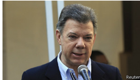
El Partido de la U, del presidente Santos, tendrá que contar con aliados en el senado colombiano.

A Santos, sin embargo, tampoco le debe haber