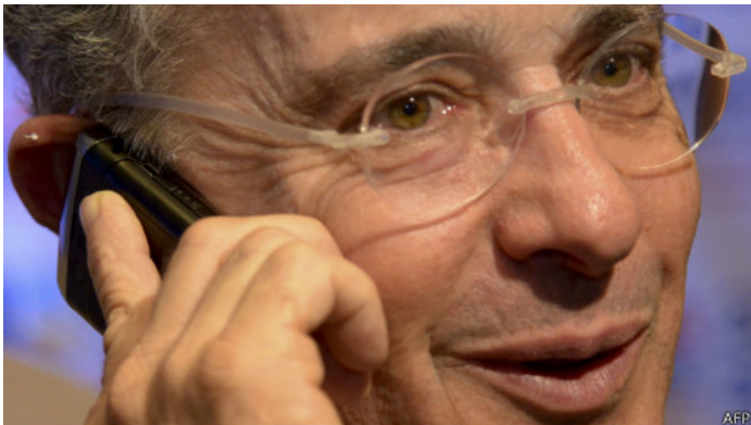
El expresidente Álvaro Uribe queda como líder de la oposición a Santos.

El resultado del cacareado "voto en blanco" fue sin embargo decepcionante, de poco más del 5%. Aunque hubo una excepción: las elecciones para el Parlamento Andino, en las que habría superado a todos los partidos en contienda con casi 36% de la votación.